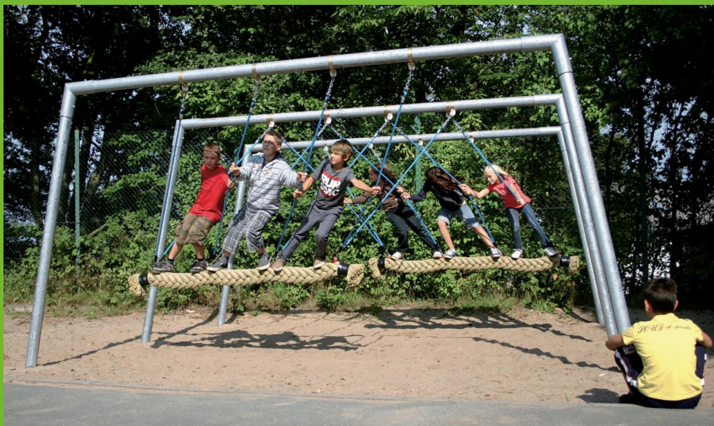
Abbildung zeigt doppelte Version mit jeweils 3 Sitzplätzen

Art.-Nr. 4585-MD4 Super-Tampen-Swinger Mini, 4-Sitzer, einfach