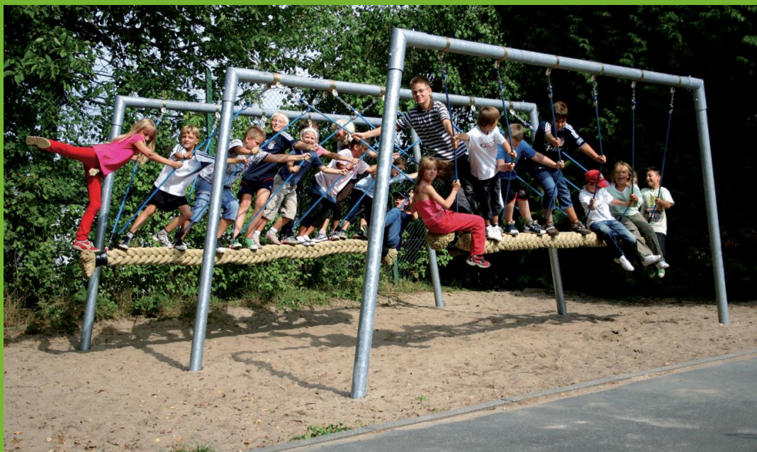
Abbildung zeigt doppelte Version mit jeweils 5 Sitzplätzen

Art.-Nr. 4585-MDD4 Super-Tampen-Swinger Mini, 4-Sitzer, doppelt