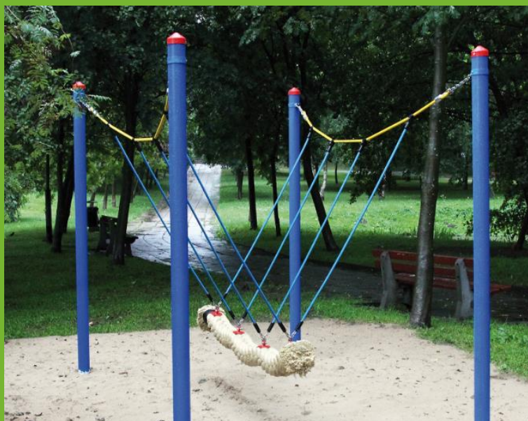
Abbildung zeigt Stahlversion

Art.-Nr. 4585PS Super-Tampen-Swinger Mini, Douglasie mit Pfostenschuhen